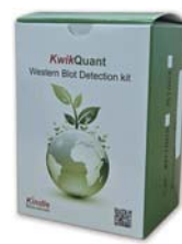
Ultra DIGITAL-ECL Substrate Solution