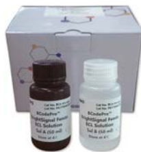
BCodePro™ BrightSignal Femto ECL Solution