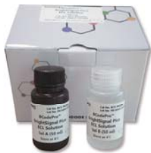
BCodePro™ BrightSignal Pico ECL Solution